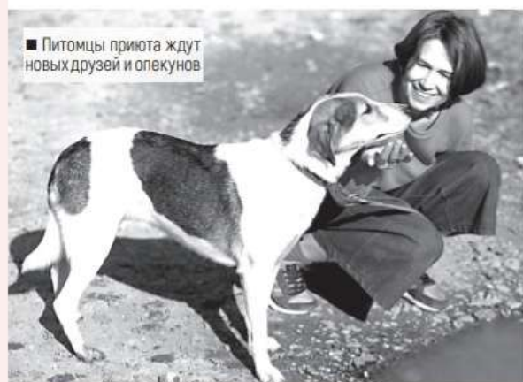
■ Питомцы приюта ждут новых друзей и опекунов