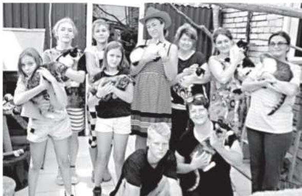
■ Веселая и дружная команда зооволонтеров приглашает вступить в их ряды

В программе: прогулки с песиками; обнимашки с котиками; фотосессия на прогулке «Я в моменте» и акция «Печенька хвостуку». Для участия в ней нужно приготовить собачьи и/или кошачьи лакомства по любому рецепту из интернета, принести их в приют или в пункт сбора (Дом быта на Ленина, 37, кабинет №22) в любой день и в сам день рождения до 13.00. Все собранные печеньки волонтеры и гости будут раздавать в приюте. Можно также передать любые другие угощения. Их массовое поедание постоянцами приюта запланировано на 14.00. Друзья, волонтеры приюта и его обитатели надеются на вашу поддержку и ждут в гости! По всем вопросам звоните директору приюта Алене Николаевой по тел.: +7-918-328-94-13.